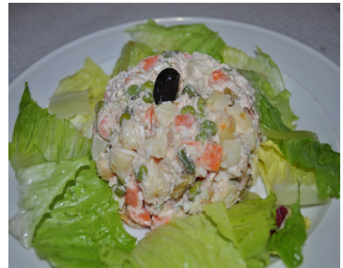
ENSALADILLA RUSSA ENSALADILLA RUSA SALADE RUSSE RUSSIAN SALAD