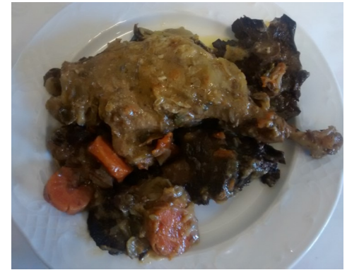
CUIXA d'ÀNEC ROSTIT MUSLO de PATO ASADO CANARD RÔTI ROAST DUCK