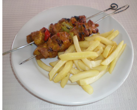
PINTXOS CASOLANS PINCHOS CASEROS BROCHETTE de PORC MEAT BROCHETTE