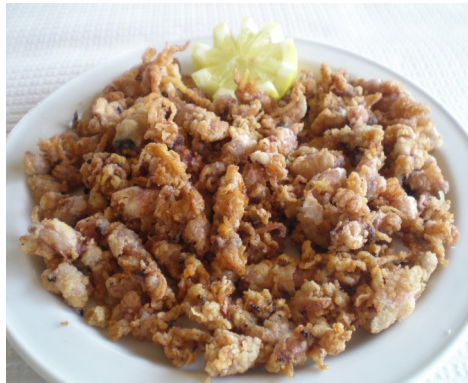
XIPIRONS FREGITS CHIPIRONES FRITOS PETIT CALMARS FRITS FRIED SQUID