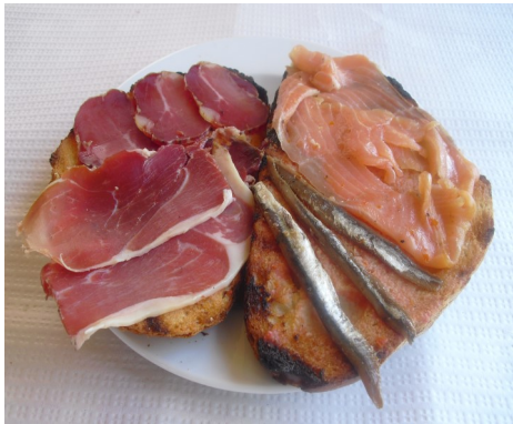
TORRADA MAR i MUNTANYA TOSTADA MAR y MONTAÑA TOAST MER et MONTAGNE TOAST SEA and MOUNTAIN