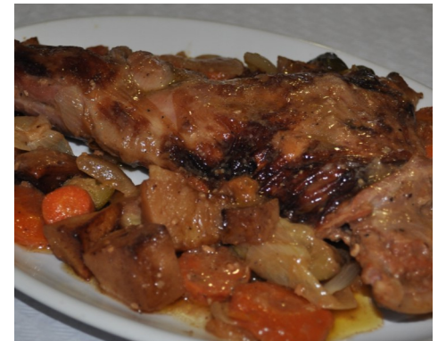
1/2 ESPATLLA de XAI ROSTIDA ESPALDA de CORDERO al HORNO 1/2 EPAULE d'AGNEAU RÔTI 1/2 ROAST SHOULDER of LAMB