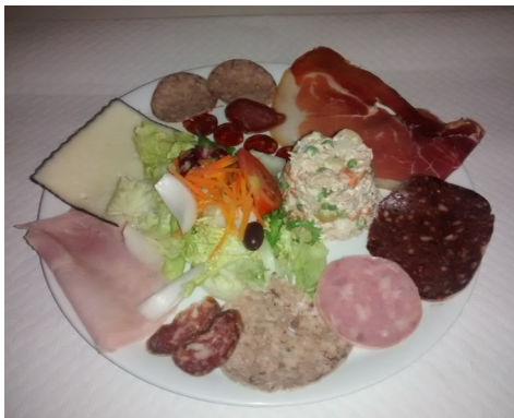
ENTREMESOS ENTREMESES ASSORTIMENT de CHARCUTERIE COLD SAUSAGES