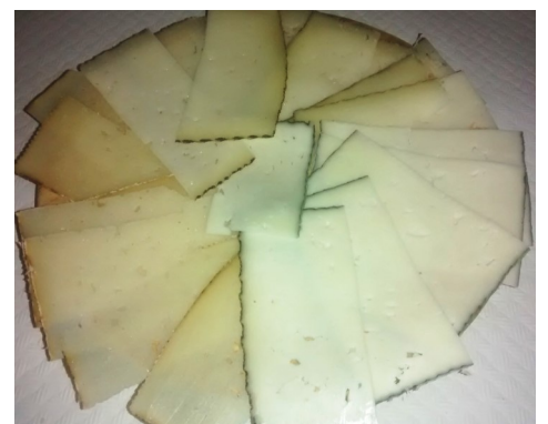
ASSORTIT de FORMATGES SURTIDO de QUESOS ASSORTIMENT de FROMAGES ASSORTED CHEESES