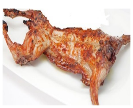
CONILLET A LA BRASA CONEJITO A LA BRASA PETIT LAPIN GRILLÉ BABY RABBIT