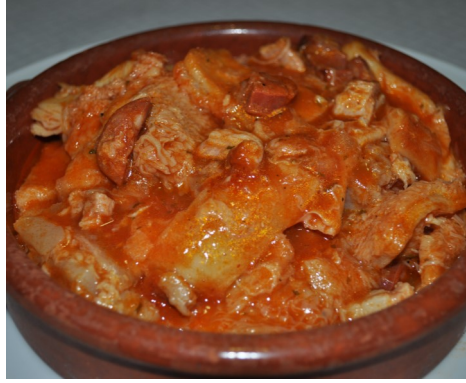
POTA i TRIPA CALLOS' TRIPES de BOEUF BEEF TRIPES