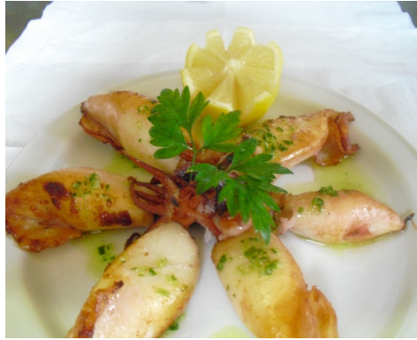
CALAMARS A LA PLANXA CALAMARES A LA PLANCHA CALMARS GRILLÉS GRILLED SQUID