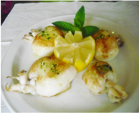
SIPIA A LA PLANXA SEPIA A LA PLANCHA SEICHE GRILLÉE GRILLED CUTTLEFISH