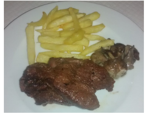
FILET DE VEDELLA SOLOMILLO DE TERNERA FILET DE VEAU GRILLED VEAL FILLET