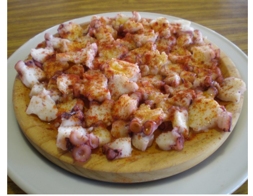
POP a la GALLEGA PULPO a la GALLEGA POULPE a la GALICIENNE GALICIA STYLE OCTOPUS