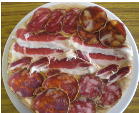
ASSORTIT d'IBÈRICS SURTIDO de IBERICOS ASSORTIMENT de IBERIQUE ASSORTED IBERICO SAUSAGES