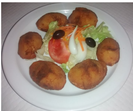
PATATES " LES ROQUES" PATATAS " LES ROQUES" POMMES de TERRE " farcis viande" POTATOES " meat stuffed"