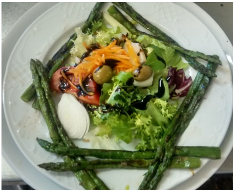
ESPÀRRECS VERDS a la BRASA ESPARRAGOS VERDES a la BRASA ASPERGES VERTES GRILLÉES GREEN ASPARAGUS GRILLED