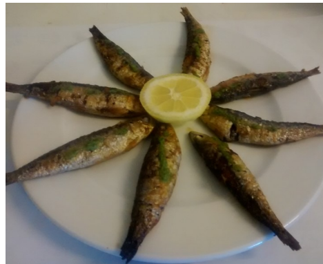
SARDINES a la PLANXA SARDINAS a la PLANCHA SARDINES GRILLÉES GRILLED SARDINES