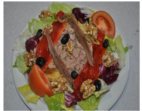
AMANIDA LES ROQUES ENSALADA LES ROQUES SALADE " LES ROQUES " "LES ROQUES" SALAD