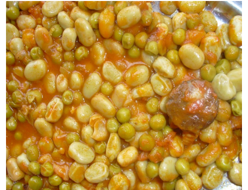
FAVES ESTOFADES HABAS a la CATALANA FEVES a la CATALANE “esttoufada” BROAD BEANS “Catalan style”