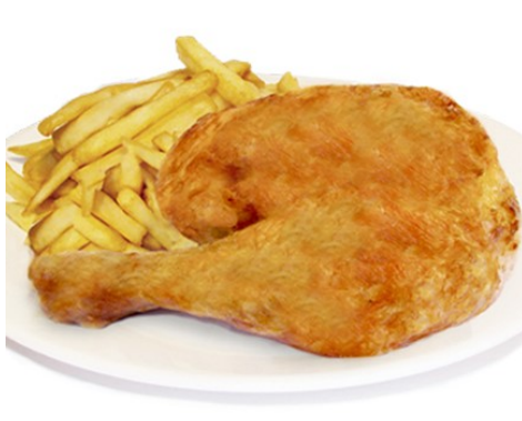
1/4 POLLASTRE BRASA 1/4 POLLO a la BRASA POULET GRILLÉ GRILLED CHICKEN