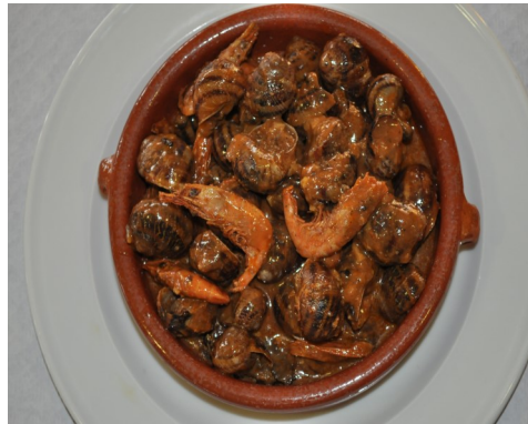
CARGOLS amb SALSA CARACOLES en SALSA ESCARGOTS en SAUCE SNAILS COOKED in SAUCE