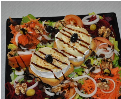
AMANIDA de FORMATGE d CABRA ENSALADA de QUESO de CABRA SALADE de FROMAGE de CHEVRE GOAT CHEESE SALAD