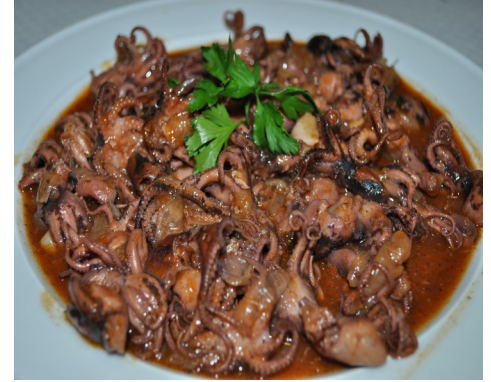
POPETS AMB SALSA PULPITOS EN SALSA PETIT POULPES a la SAUCE BABY OCTOPUSES in SAUCE