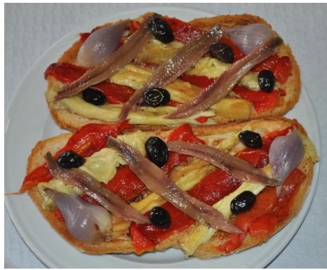
ESCALIVADA i ANXOVES de l'ESCALA ESCALIVADA y ANCHOAS de l'ESCALA TOAST à ESCALIVADA avec ANCHOIS TOAST ANCHOVIES and ESCALIVADA