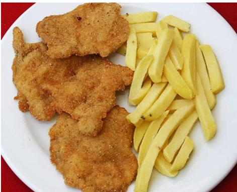
LLOM ARREBOSSAT LOMO EMPANADO ESCALOPE de PORC PORK ESCALOPE