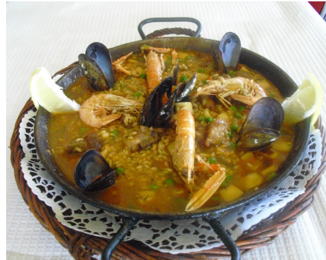
PAELLA d'ARRÓS PAELLA de ARROZ PAELLA MAISON HOUSE PAELLA