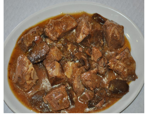
VEDELLA GUISADA amb BOLETS TERNERA GUISADA con SETAS VEAU aux CHAMPIGNONS VEAL with MUSHROOMS