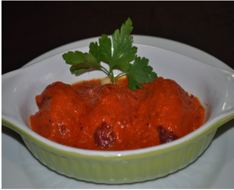
PIQUILLOS FARCITS de BACALLÀ PIQUILLO RELLENO de BACALAO PIQUILLO FARCIS de MORUE COD STUFFED with PIQUILLO