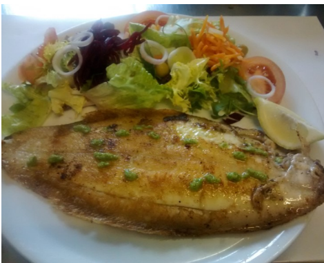
LLENGUADO a la PLANXA LENGUADO a la PLANCHA SOLE à la PLANCHA GRILLED LEMON-SOLE