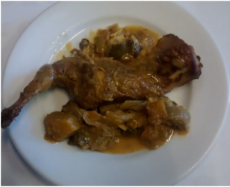
CONILL ROSTIT CONEJO ASADO LAPIN RÔTI ROAST RABBIT