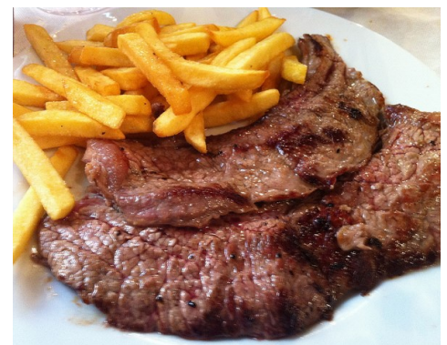
BISTEC DE VEDELLA BISTEC DE TERNERA BIFTECK DE VEAU VEAL STEAK