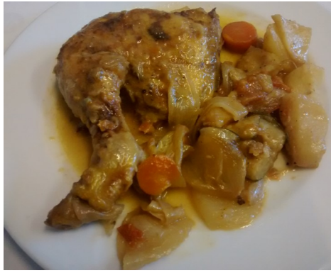
POLLASTRE ROSTIT POLLO AL HORNO POULET RÔTI ROAST CHICKEN