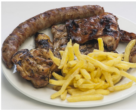
GRAELLADA de CARN PARRILLADA de CARNE ASSORTIMENT DE VIANDES ASSORTED GRILLED MEATS