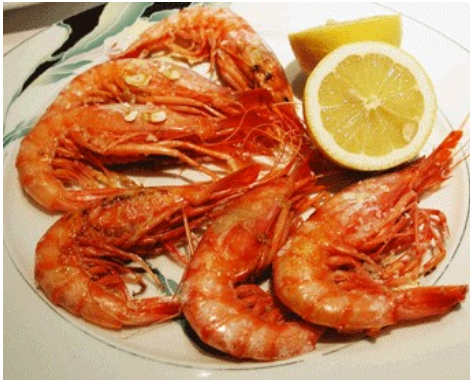
GAMBES a la PLANXA GAMBAS a la PLANCHA CREVETTES GRILLÉES GRILLED SHRIMPS