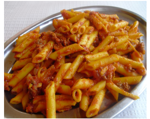
MACARRONS a la BOLONYESA MACARRONES a la BOLOÑESA MACARONIS à la BOLOGNAISE PENNE BOLOGNESE "macaronnis"