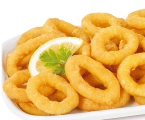
CALAMARS a la ROMANA CALAMARES a la ROMANA CALMARS à la ROMAINE SQUID RINGS in BATTER