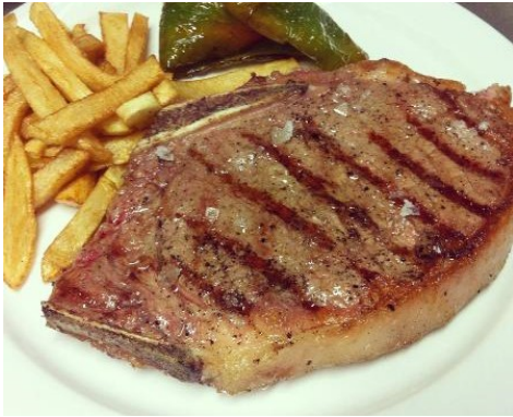
ENTRECOT VEDELLA de GIRONA ENTRECOT TERNERA de GIRONA ENTRECÔTE de VEAU de GIRONA VEAL ENTRECOTE from GIRONA