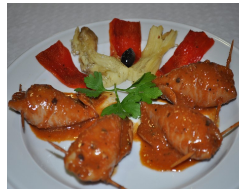
CALAMARS FARCITS de PEIX CALAMARES RELLENO PESCADO CALMARS FARCIS de POISSON STUFFED SQUID FISH