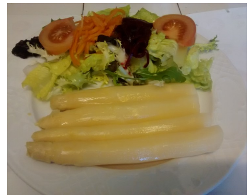
ESPÀRRECS B. amb AMANIDA ESPARRAGOS B. con ENSALADA ASPERGES avec SALADE VERTE ASPARAGUS with GREEN SALAD