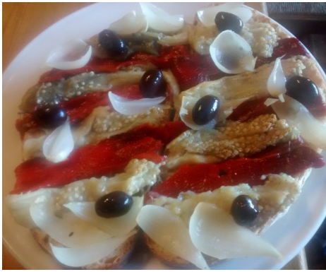
TORRADES amb ESCALIVADA TOSTADAS con ESCALIVADA TOAST avec LEGUME GRILLÉE GRILLED VEGETABLES on TOAST