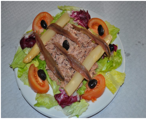
AMANIDA de TONYINA i ANXOVES ENSALADA de ATÚN y ANCHOAS SALADE de THON et ANCHOIS TUNA and ANCHOVIES SALAD