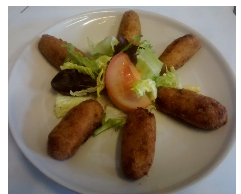
CROQUETES CASOLANES CROQUETAS CASERAS CROQUETTES MAISON " viande" HOME-MADE CROQUETTES