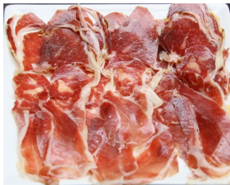
TORRADES i PERNIL IBÈRIC TOSTADAS con JAMÓN IBERICO TOAST avec JAMBON IBÉRIQUE TOAST with IBERICO HAM