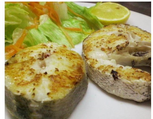
LLUÇ A LA PLANXA MERLUZA a la PLANCHA MERLU GRILLÉ GRILLED HAKE