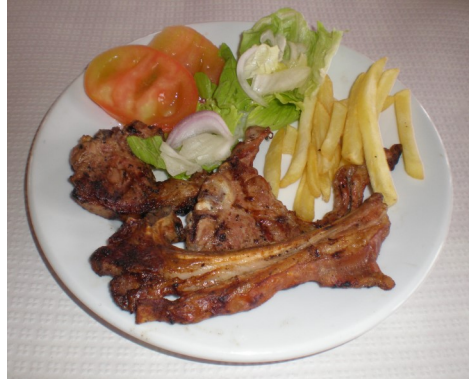
XAI A LA BRASA CORDERO A LA BRASA AGNEAU GRILLÉ CHARCOAL-GRILLED LAMB