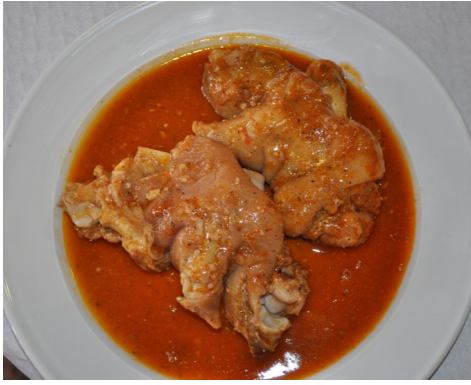
PEUS DE PORC amb SALSA PIES DE CERDO en SALSA PIEDS de PORC avec SAUCE PIG's TROTTERS in SAUCE