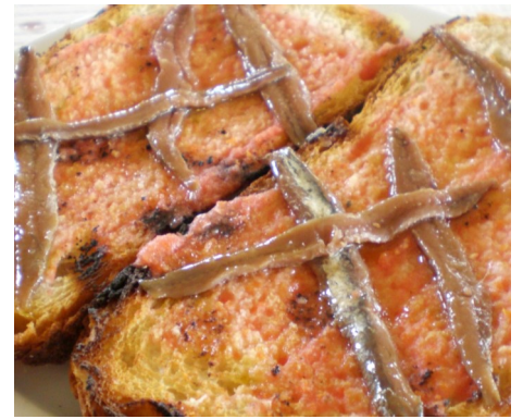
TORRADES-ANXOVES de l'ESCALA TOSTADAS-ANCHOAS de l'ESCALA TOAST et ANCHOIS de ESCALA ANCHOVIES l'ESCALA on TOAST