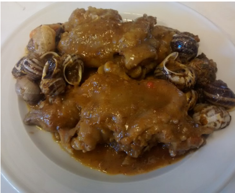
PEUS de PORC i CARGOLS PIES de CERDO y CARACOLES PIEDS de PORC avec ESCARGOTS PIG TROTTERS with SNAILS