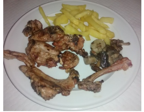
CABRIT a la BRASA CABRITO a la BRASA CHEVREAU GRILLÉ CHARCOAL-GRILLED GOAT KID