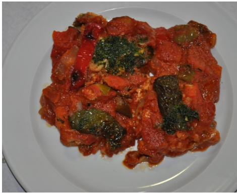
BACALLÀ amb SAMFAINA BACALAO en SAMFAINA MORUE à la RATATOUILLE COD with RATATOUILLE