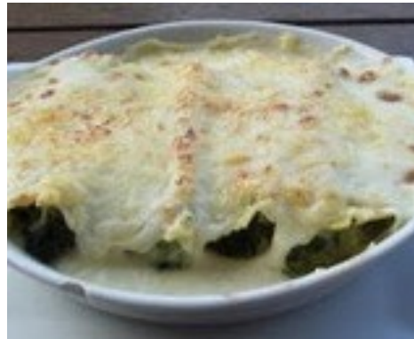
CANELONS de CARN CANELONES de CARNE CANNELLONI de VIANDE CANNELLONI of MEAT