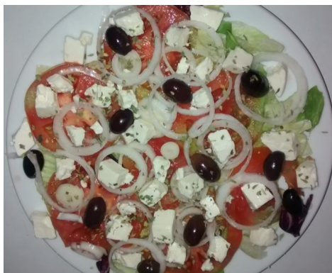
AMANIDA GREGA ENSALADA GRIEGA SALADE GRECQUE à la FETA GREEK SALAD with FETA